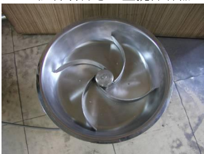
※2 混合羽付き皿型攪拌容器

羽の付いた皿型攪拌（かくはん）容器（※2）と空気中の水をとりこんで水溶液となる潮解性無機物、および水溶液となった潮解性無機物と水を分離するための加熱蒸留装置（※3）の設置のみ。空気のある場所ならどなたでも使用可能です。また、原料となる潮解性無機物は 100% 再利用できるのでコストを削減できます。